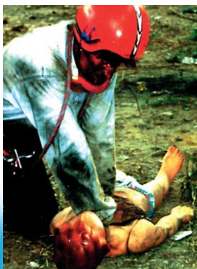
Занятия на полигоне

* Эти позиции комплектуются по желанию заказчика